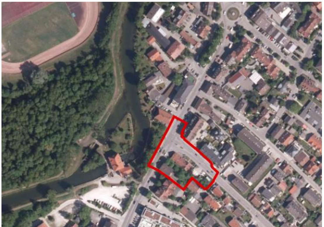
Abb. 8 Lageplan mit Luftbild, ohne Maßstab, Quelle: Quelle: Bayerische Vermessungsverwaltung 2018

Der Geltungsbereich der Bebauungsplanänderung umfasst die Grundstücke Fl.Nrn. 66/11, 66/12, 1233 TF, 1233/11, 1233/22, 1233/21, 44/1, 44/2, 45/2, 81TF, 81/21 TF, 81/22 TF, 81/23 TF, 81/26 TF, 81/35 TF, 47/1, 47, 49/1, 47/3, 47/4 Gemarkung Olching, auf einer Fläche von etwa 3.719 qm. Das Plangebiet liegt im Zentrum der Stadt Olching unmittelbar gegenüber dem denkmalgeschützten Kraftwerk und schließt die Einmündung der Münchner Straße in die Hauptstraße mit ein.