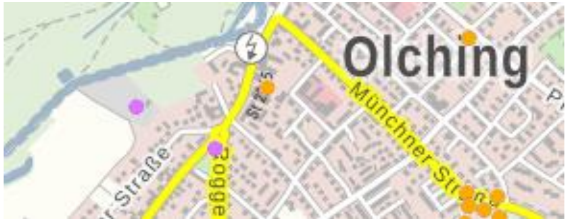
Abb. 6 Bohrungen 0-10m (lila) und 10 - 40m (orange), ohne Maßstab