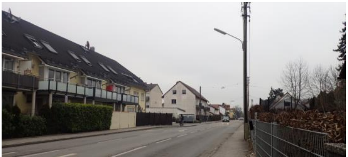
Abb. 12 Blick von der Kreuzung Hauptstraße/ Münchner Straße in die Münchner Straße, Quelle: eigene Aufnahme PV München, Januar 2022)

Die Bebauung nördlich der Münchner Straße ist zweigeschossig mit ausgebautem Satteldach und südlich der Münchner Straße eingeschossig mit ausgebautem spitzem Satteldach.