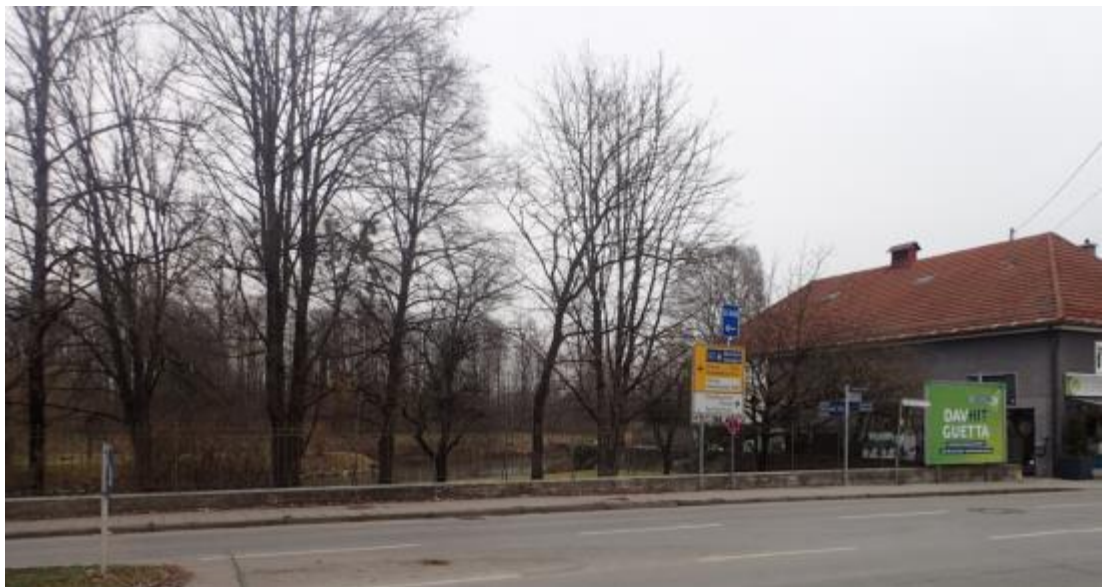
Abb. 10 Blick von der Kreuzung Hauptstraße/ Münchner Straße Richtung Mühlbach

Das Kraftwerk auf der gegenüberliegenden Straßenseite liegt etwas zurückversetzt, so dass von der Hauptstraße 65, 63 ein freier Blick über die öffentliche Grünfläche ins Landschaftsschutzgebiet „Untere Amper“ besteht.