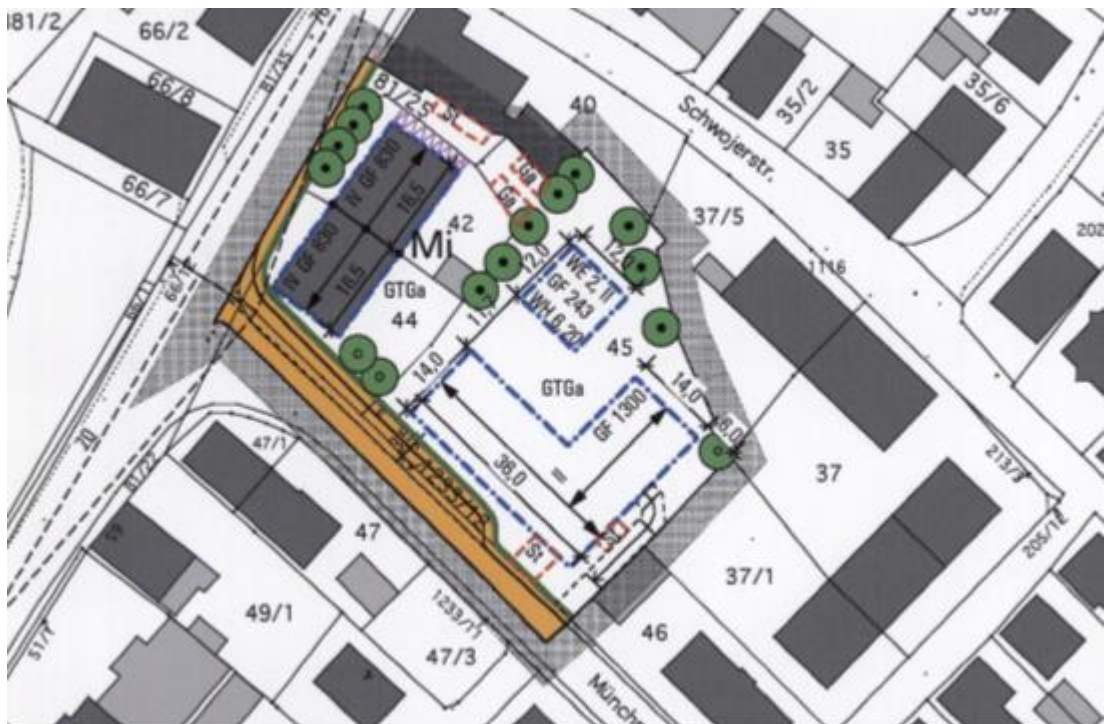
Abb. 3 Ausschnitt aus der Planzeichnung der rechtsverbindlichen 5. Änderung des Bebauungsplans Nr. 76 „Hauptstraße II“ i.d.F. vom 26.06.2006

Die Grünordnung sieht den Erhalt von vier Bäumen an den in der Planzeichnung festgesetzten Standorten vor. Zudem sind die Flächen über Tiefgaragen in den nicht überbauten Bereichen zu begrünen.