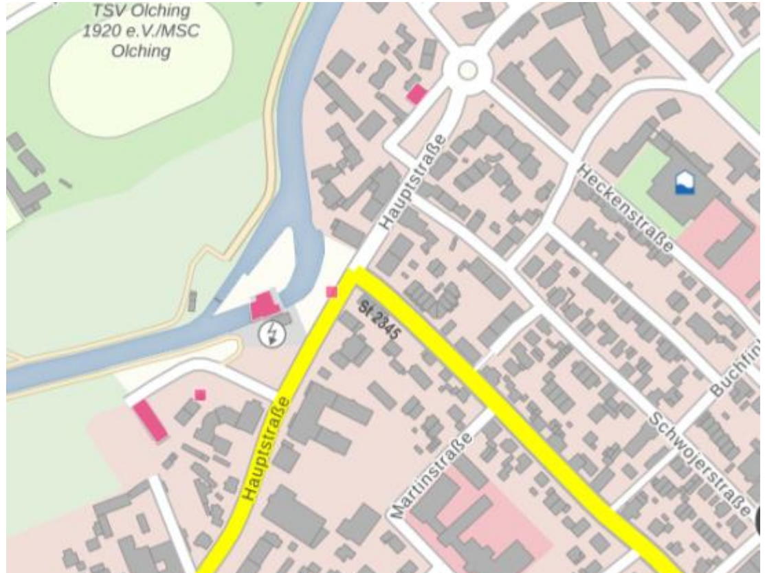
Abb. 4 Bau- und Bodendenkmäler, ohne Maßstab

Unmittelbar nordwestlich des Plangebiets auf der gegenüberliegenden Seite der Hauptstraße befindet sich das Wasserkraftwerk, das mit seinem kubischen Walmdachbau, Putzgliederung und Dachreiter aus dem Jahr 1922 und der schmiedeeisernen Einfriedung denkmalgeschützt ist (D-1-79-142-8).