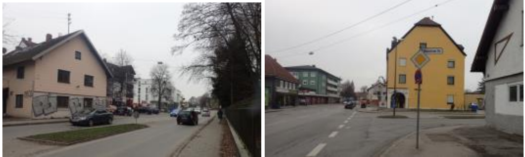
Abb. 11 Blick von der Kreuzung Hauptstraße/ Münchner Straße in die Hauptstraße nach Süden und Norden, Quelle: eigene Aufnahme PV München, Januar 2022)

Die Bebauung nördlich der Münchner Straße ist zweigeschossig mit ausgebautem Satteldach und südlich der Münchner Straße eingeschossig mit ausgebautem spitzem Satteldach.