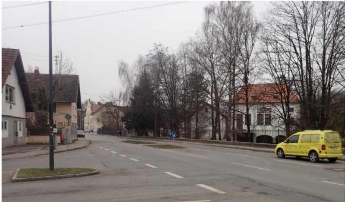
Abb. 9 Blick von der Kreuzung Hauptstraße/ Münchner Straße Richtung Süden

Im Plangebiet rückt die Bebauung nur südöstlich der Hauptstraße unmittelbar an die Haupteerschließungsstraße heran.