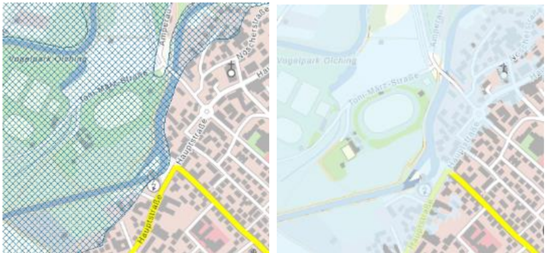
Abb. 5 HQextrem, ohne Maßstab

Im Nordwesten grenzt das per Verordnung des Landratsamtes Fürstenfeldbruck festgesetzte Überschwemmungsgebiet der Amper (21.11.2008) an (siehe Abbildung 7).