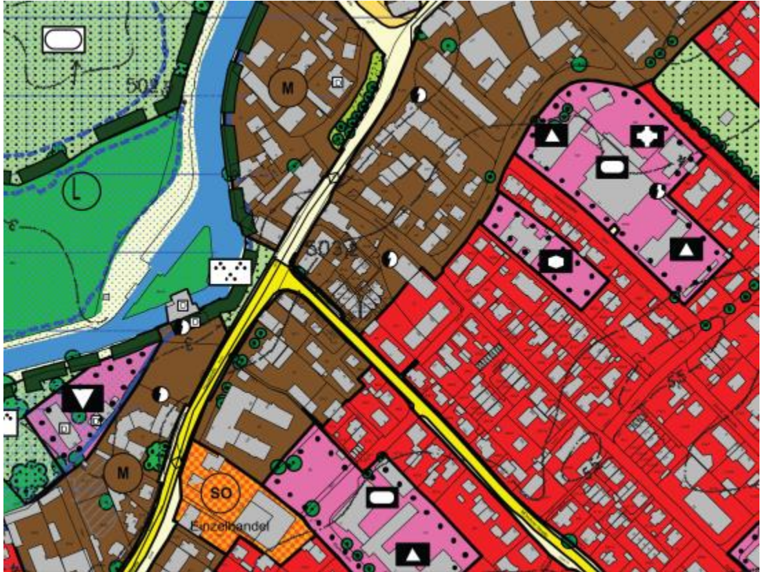
Abb. 1 Ausschnitt aus dem rechtswirksamen Flächennutzungsplan der Stadt Olching i.d.F. der Bekanntmachung vom 19.09.2016