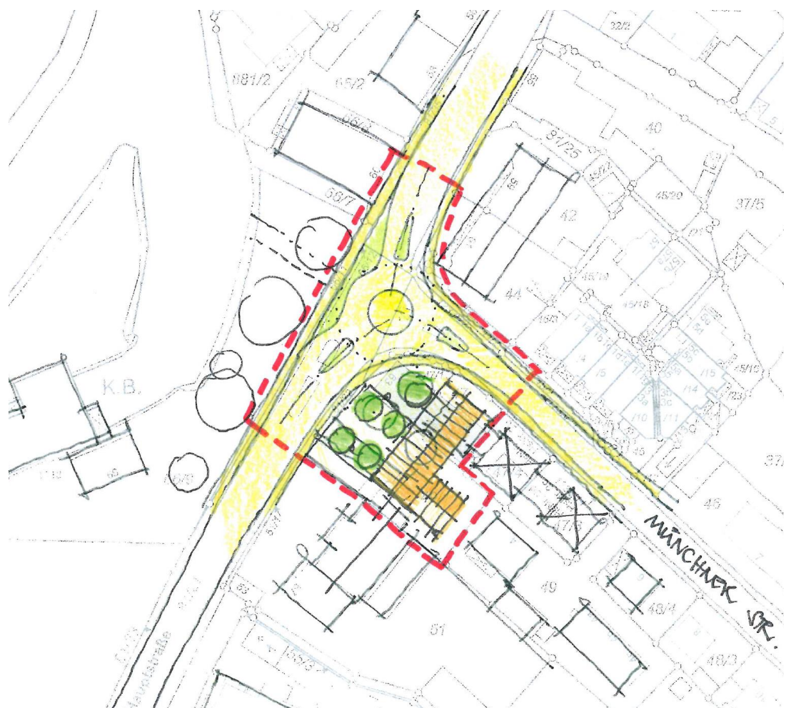
Abb. 14 Städtebaulicher Entwurf (Bauamt der Stadt Olching, 09.09.2019)

Grundsätzlich soll entlang der Hauptstraße eine verdichtete höhere Bebauung mit vorgegebenen Nutzungen fürs Erdgeschoss und im Bereich der rückwärtigen Münchner Straße eine abgestufte niedrigere Bebauung ohne Vorgabe der Nutzungen im Erdgeschoss angestrebt werden. Damit reagiert die Planung auf die angrenzende Bebauung und Nutzung.