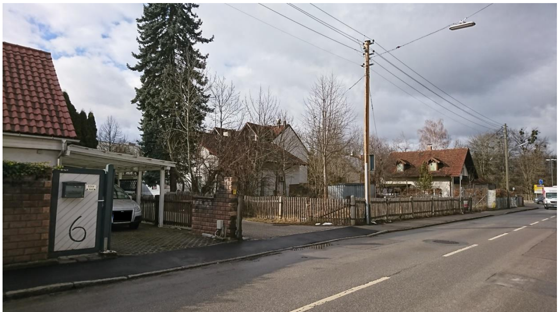
Abb. 13 Blick von Münchner Straße zur Kreuzung auf Baulücke