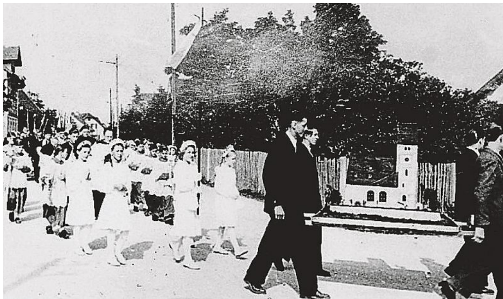
Umzug zur Einweihung des Kolpingheims, 1951