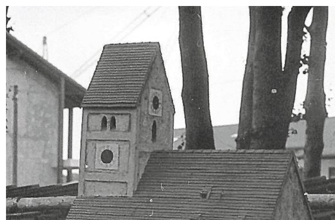
Modell vor der Restauration