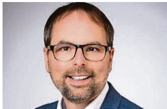
Andreas Magg, Erster Bürgermeister.

und freuen uns auf zahlreiche Veranstaltungen! Es geht gleich los mit der 8. Olchinger Musikknacht am 6. Mai, an der auch wieder unser KOM teilnimmt - dort gibt es ab 20 Uhr Boogie mit einer Prise Südstaatenrock von den Wild Magnolia Mariachis. Mit dem Musikknacht-Shuttle kann man alle sechs teilnehmenden Locations super erreichen und am Nöscherplatz lassen vier DJs Festivalfeeling aufkommen.