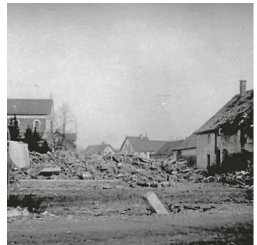
22. Februar 1944