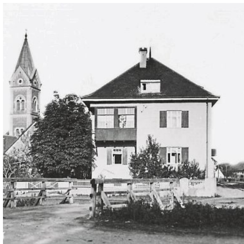
Halbinger-Haus mit der Holzbrücke über dem ab 1934 verrohrten Schramlbach um ca. 1910