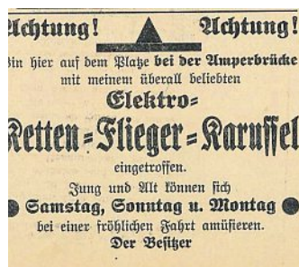
Nachrichtenblatt 11. Juni 1932

Leider sind der Fotograf und das genaue Datum der Aufnahme vom fröhlichen Treiben in Olching vor dem großen Kettenkarussell ebenso wenig bekannt wie die Namen der drei schicken jungen Männer, die anscheinend sehr mit sich selbst beschäftigt waren. Hinweise finden sich jedoch im Olchinger Nachrichtenblatt für Olching und Umgebung in den Jahren 1932 und 1933: Die Werbeanzeige für ein „Elektro-Ketten-