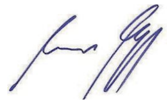
Andreas Magg Erster Bürgermeister