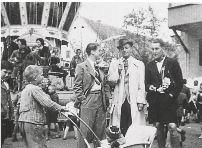
Kettenkarussell in den 1930er Jahren