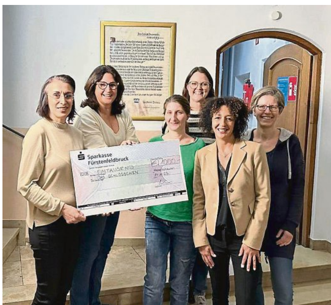
30.6.24 statt - es wird nicht ein Fest von Frauen für Frauen nur ein Flohmarkt, sondern

Erneut konnten wir mit einer Spende von 1000 Euro aus dem Verkauf im Juli ein Herzensprojekt unterstützen, nämlich den Verein „Haus des Lebens Dachau e.V.“. Der Verein betreibt mit bewundernswertem Einsatz die Mutter-Kind-Einrichtung „Das Schlösschen“ in Hebertshausen. Der nächste Frauensachen-Flohmarkt mit großem Rahmenprogramm (Kino-Matinee, Vortrag, zwei Konzerte, Buch- und Keramikausstellung, Bar der Begegnung uvm.) findet übrigens am Wochenende vom 28.6.-